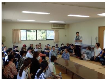
市民の方々、企業や大学など、多くの方々にご参加頂きました

平成29年度 第1回 馬島清掃団(2017年6月4日実施) 参加者:55名 回収量:387.5kg