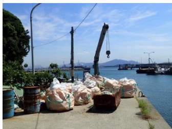
ゴミは港からさらに船で本土へ 大きな冷蔵庫も回収しました