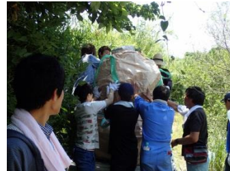
ヨイショ! 軽トラに積み込み港へ運びます