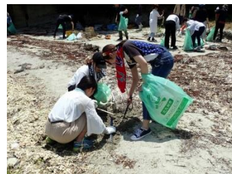
小さなゴミも丁寧に 回収していきます