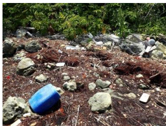
相変わらず無くならない 様々な漂着ゴミ