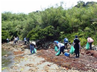
みんなで力を合わせれば 広い海岸もすぐに綺麗になります