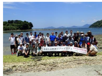
パシャ! 記念撮影 お疲れ様でした

今回、参加協力頂きました学校・企業・団体・行政 様(順不同・敬称略) 市内外地域の皆様、北九州市漁業協同組合馬島支所、浅野工芸舎、北九州市立大学、瑠璃スキッチン、 私たちの未来環境プロジェクト、㈱ケイエス企画、ニホン・ドレン㈱福岡営業所、その他