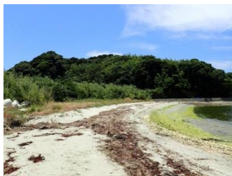
綺麗になった海岸は やっぱり気持ちがいいです