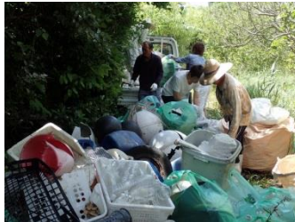
回収したゴミは計量後、 海岸から軽トラへ小運搬します