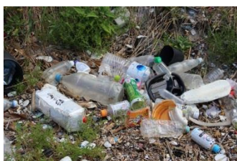
相変わらず、プラスチック製の漂着ゴミが多いです。

平成29年度 第2回 馬島清掃団(2017年9月3日実施) 参加者:74名 回収量:426.3kg