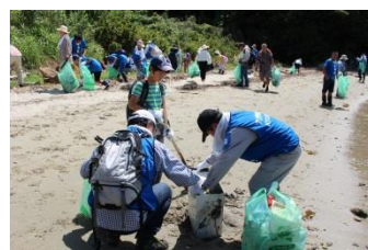
砂に埋まったゴミも丁寧に取り除きます。