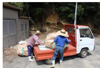
島民の方々も一緒に活動しています。