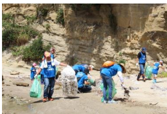
親子でのご参加も多かったです。何かを考えるキッカケになった?