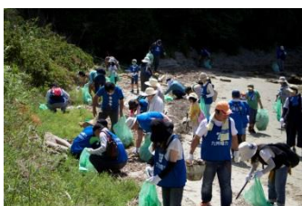
70名を超える方々にご参加頂きました。