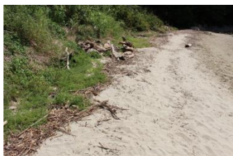
多くの方々のご協力で短時間で綺麗になりました。