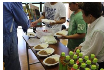
汗を流した後のカレーは美味しいね。

今回、参加協力頂きました学校・企業・団体・行政 様(順不同・敬称略) 市内外地域の皆様、北九州市漁業協同組合馬島支所、九州電力(株)、中島市民センター、北九州市青少年課ボランティアステーション、瑠璃スキッチン、私たちの未来環境プロジェクト、(株)ケイエス企画、ニホン・ドレン(株)福岡営業所、(有)ワフプレスワン、よしみ工業(株)、その他