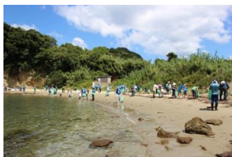
9月に入り暑さも和らいだせいか、気持ちよく活動できました。