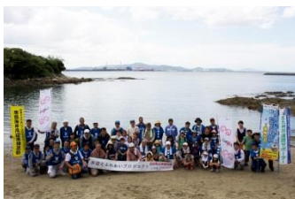
綺麗になった浜で海をバックに集合写真。