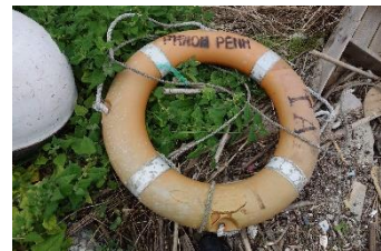
海外から流れ着いた 浮き輪なども見られます