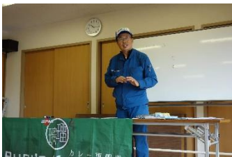
まずは清掃活動に関する 注意事項などの説明を受けます

令和元年度 第2回 馬島清掃団(2019年11月10日実施) 参加者:33名 回収量:267kg