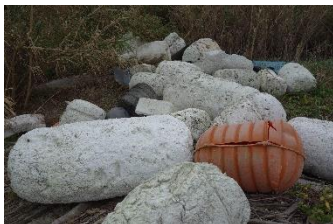
魚具などの発泡スチロールも 多く流れ着いています