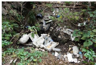
海岸には漂着ゴミが 流れ着き溜まっています