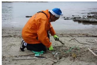
砂浜に埋まったロープ類は 道具で切断します