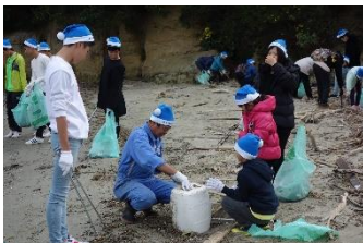
砂浜に埋まったゴミは 回収に苦労します