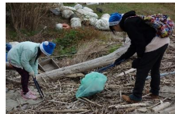
ブルーサンタの帽子を被り 活動しました