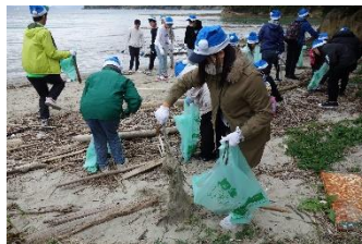
みんなで力を合わせて ゴミを拾います