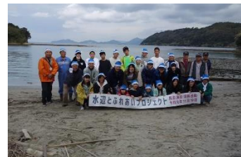
みなさま お疲れ様でした!

今回、参加協力頂きました学校・企業・団体・行政 様(順不同・敬称略) 市内外地域の皆様、北九州市漁業協同組合馬島支所、北九州市青少年課ボランティアステーション、 瑠璃ズキッチン、私たちの未来環境プロジェクト、ニホン・ドレン(株)福岡営業所、(有)ソフトブレスワン、 城野プログラミング教習所、その他